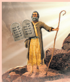
Moses med stentavlerne