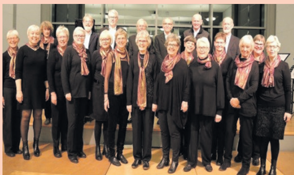
Nykøbing F. koret