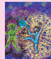
Jesus og Satan

Den 1. søndag i Fastetiden, den 9. marts kl. 11.00 i Systofte Kirke og kl. 14.00 i Nr. Ørslev 14.00 Kirke. På dagen, hvor Jesus modstår Satan i ørkenen, skal vi høre en billedfortælling om, hvordan man forsvare sig mod onde kræfter i dag med det, som Paulus kalder for "Guds fulde rustning" .